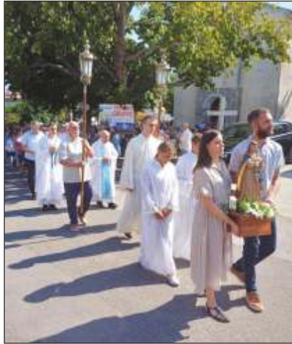
Svečanu misu u 10.30 sati predvodio je, uz rasopašnjarskog župnika